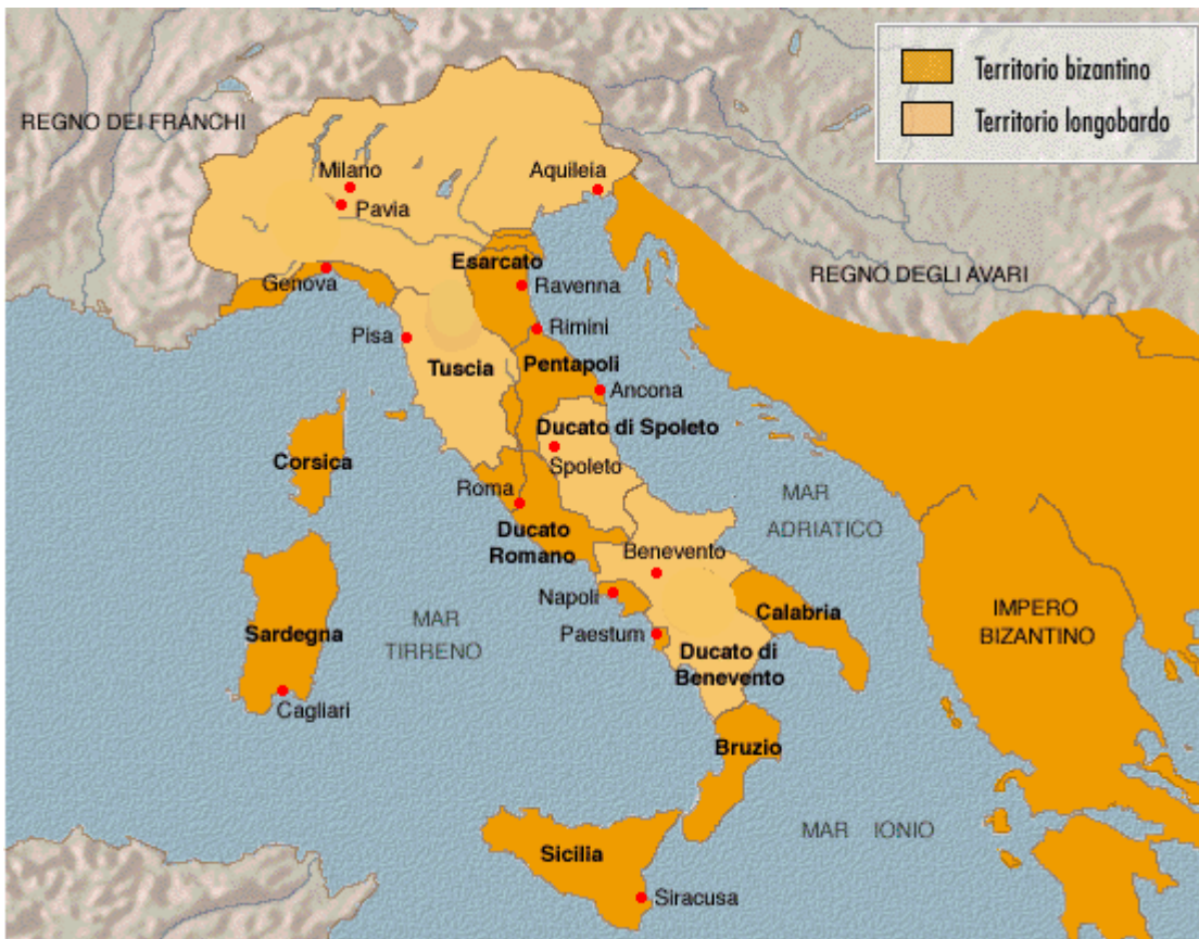
Figura 1 L'Italia longobarda e bizantina